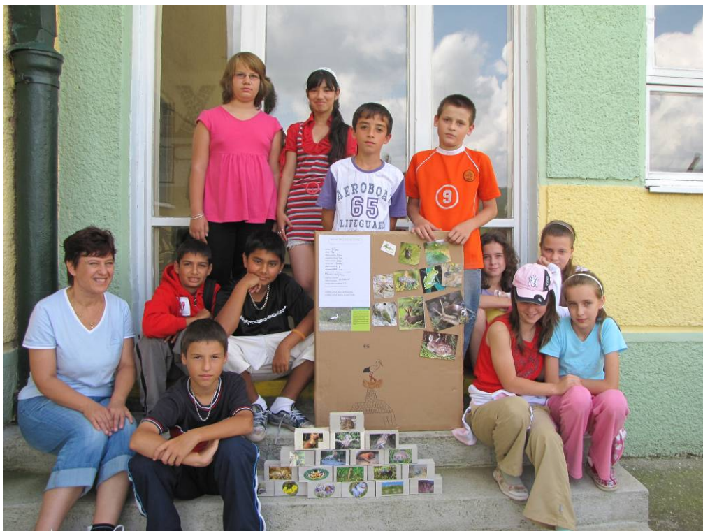
Deň bociana na ZŠ v Cinobani

26.10.2009, ZŠ s VJM Jesenské – 4.9.2009, ZŠ Vajanského Lučenec – 18.9.2009). Vzťah verejnosti k bocianom v súčasnosti bol zisťovaný aj anketou.