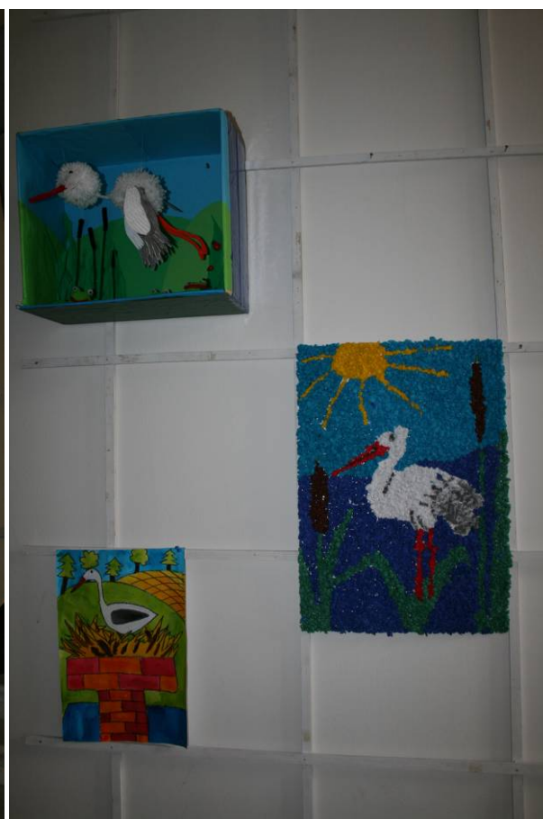
Výstava z detskej tvorby na tému Bocian v priestoroch Východoslovenského múzea v Košiciach