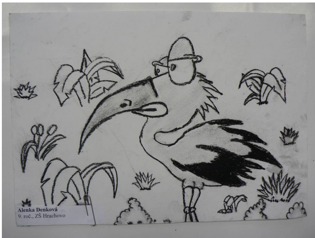
Výtvarná tvorba žiakov zo ZŠ Hrachovo