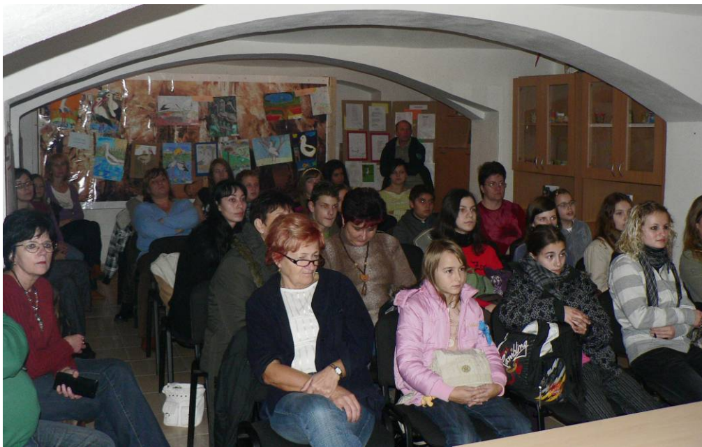
Vyhodnotenie aktivít v roku 2009 v priestoroch Správy CHKO Cerová vrchovina v Rimavskej Sobote

Záverečné vyhodnotenie aktivít v okrese Rimavská Sobota prebiehalo v priestoroch Správy CHKO Cerová vrchovina dňa 20.11.2009. Za účasti pedagógov a troch zástupcov jednotlivých škôl boli vyhodnotenú literárne a výtvarné práce žiakov na tému Bocian. Súčasťou podujatia boli prezentácie vlastných aktivít žiakov v elektronickom prevedení v PowerPointe a otvorenie výstavy detských prác, ktorá bola verejnosti prístupná do 18. 12. 2009 v priestoroch Správy Chránenej krajiny Cerová vrchovina.