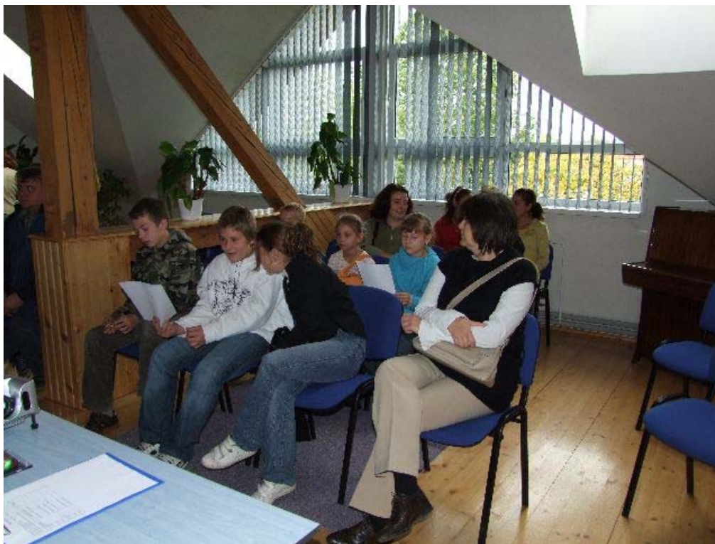
Hodnotenie aktivít v roku 2009 v Rožňave