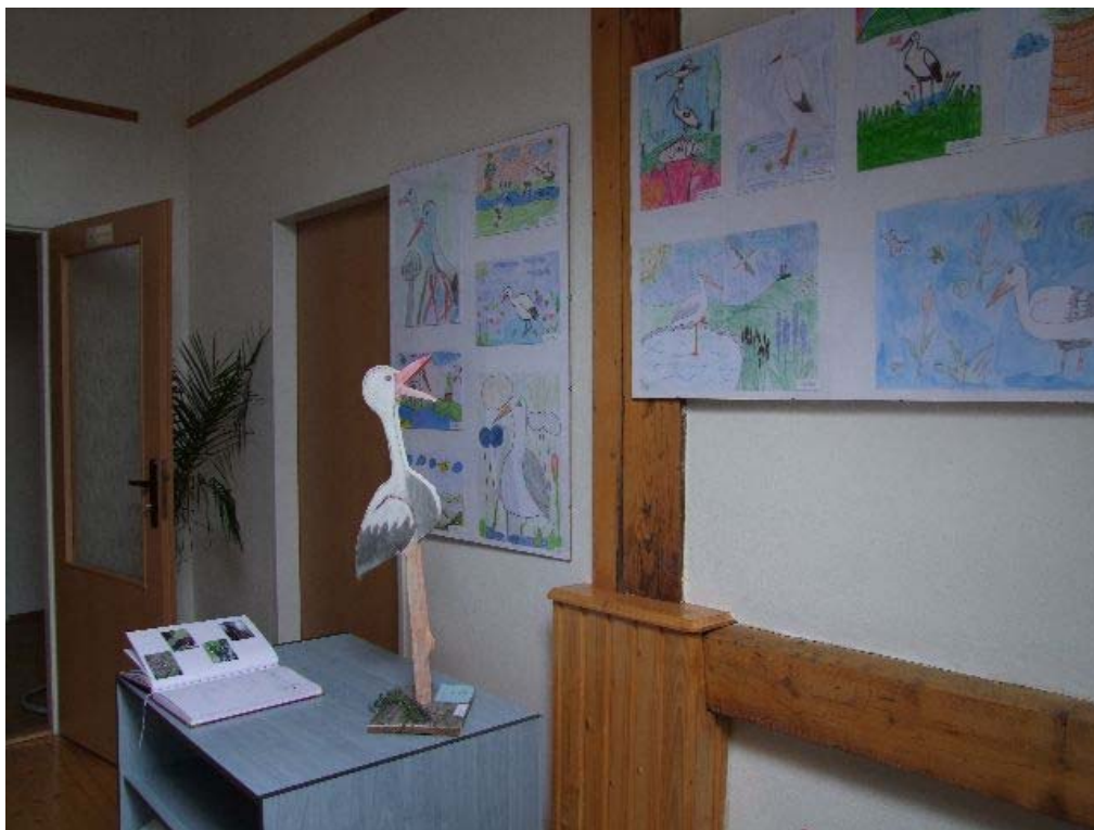
Výstavka detských prác v Gemerskej knižnici v Rožňave

Žiaci podľa vopred rozoslaných metodických pokynov sledovali hniezda bocianov v obci, zaznamenali jarný prilet na hniezdo, počty mláďat a dátum odletu bocianov z hniezda. Okrem údajov o hniezdach spracovali vo výtvarnej a literárnej podobe motív bociana tak, že z prác bola dňa 13.10.2009 zostavená a inštalovaná výstava detských prác v Gemerskej knižnici Pavla Dobšinského v Rožňave. Spolu sa na výstave prezentovalo 46 výtvarných, 12 literárnych a 5 kolektívnych prác. Na otvorení výstavy spojenom s vyhodnotením aktivít boli prezentované aj samostatné výstupy žiakov a reprodukované literárne práce. Priebeh tohtoročných aktivít ako aj záverečné vyhodnotenie ročníka ekovýchového programu bocian v rožňavskom a košickom okrese je prístupný na internetovej adrese www.sopsr.sk/slovkras/bocian .