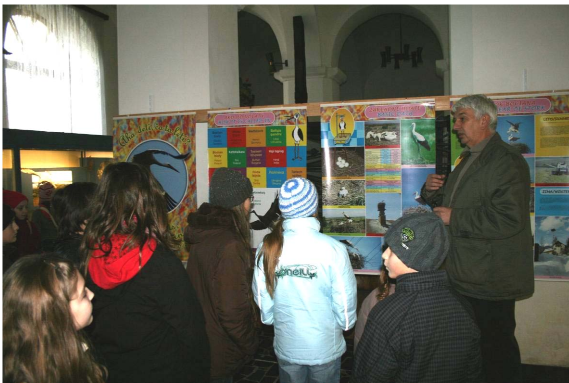
Výstava Aha deti čo to letí v Zemplínskom múzeu v Michalovciach