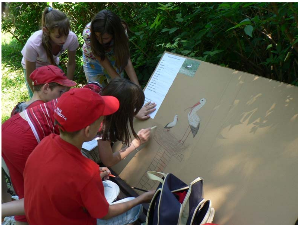
Deň bociana na ZŠ Dobšinského v Rimavskej Sobote