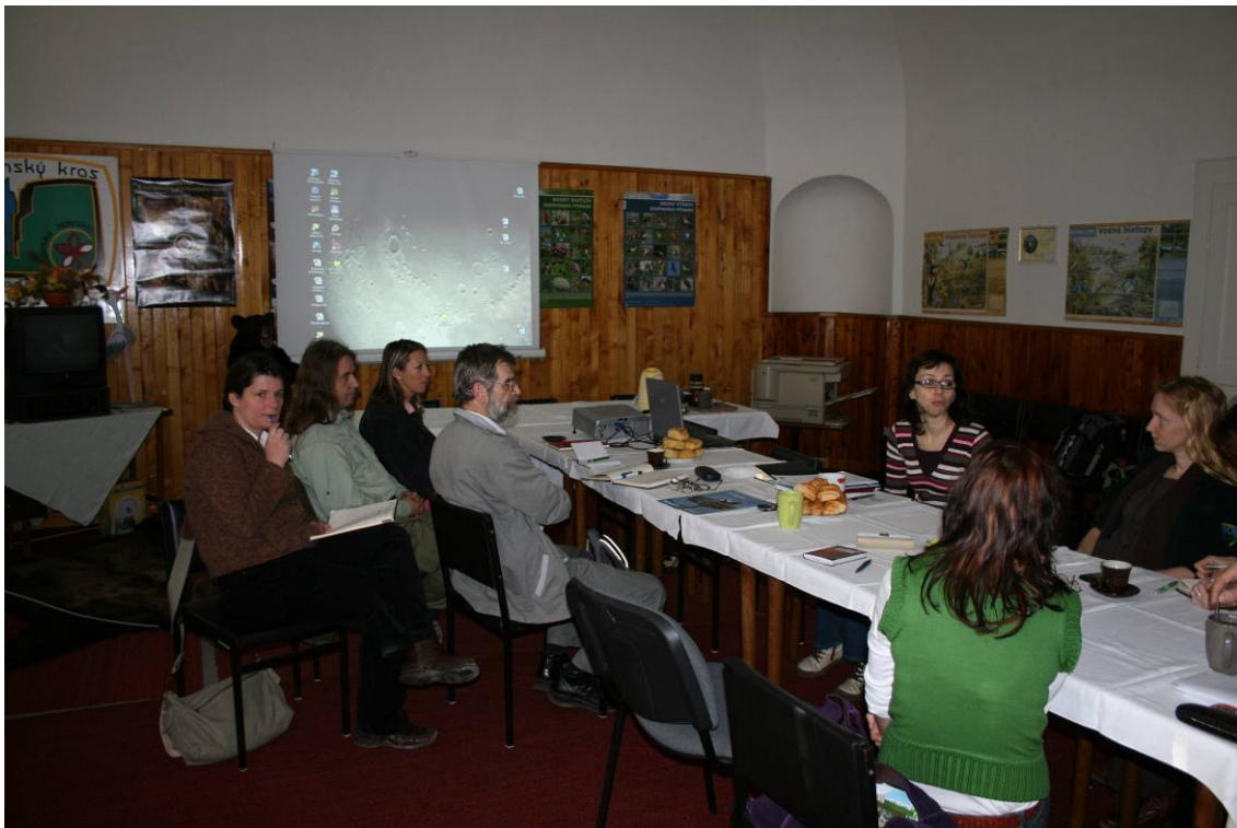
Pracovné stretnutie aktivistov spolu s maďarskými kolegami na začiatku roka 2009

Začiatku aktivít predchádzalo spoločné stretnutie koordinátorov a aktivistov aj spolu s maďarskými kolegami. Na stretnutí v Brzotíne 10.2.2009 boli vytýčené hlavné podujatia, ktoré vychádzali z možností aktivistov a prostriedkov poskytnutých Lichtenštajnskou Nadáciou Ciconia na projekt v roku 2009.