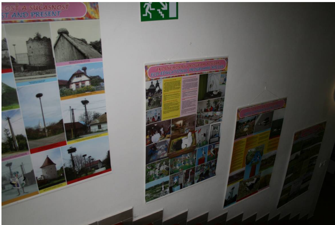
Výstava Aha deti čo to letí v priestoroch Gemerskej knižnice P. Dobšinského v Rožňave

Celkovo v roku 2009 bolo do programu v štyroch regiónoch Slovenska zapojených spolu 30 škôl. Od autorov jednotlivých prác sme získali 185 výtvarných prác, 52 literárnych prác a 9 prezentácií v PowerPointe.