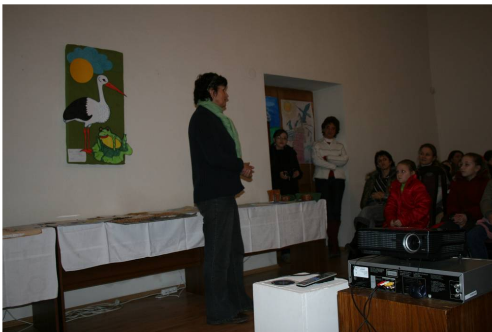
Vyhodnotenie aktivít v roku 2009 v Zemlinskom múzeu v Michalovciach