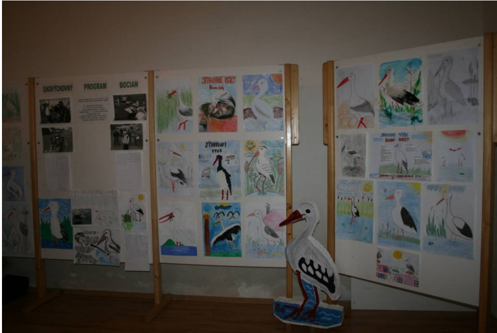
Výstavka detských prác Michalovce

Hodnotenie aktivít spojené s otvorením výstavy detských prác, prezentáciou aktivít a otvorením výstavy Aha deti čo to letí v michalovskom okrese prebiehalo dňa 9.12.2009 v priestoroch Zemplínskeho múzea v Michalovciach. Za účasti 68 detí zapojených do programu boli vyhodnotené aktivity jednotlivých škôl spojené s besedou účastníkov k pokračovaniu programu v roku 2010.