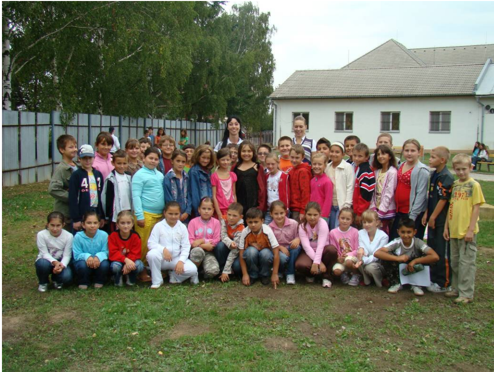
Účastníci Dňa bociana v Jesenskom

Záverečné vyhodnotenie aktivít v okrese Rimavská Sobota prebiehalo v priestoroch Správy CHKO Cerová vrchovina dňa 20.11.2009. Za účasti pedagógov a troch zástupcov jednotlivých škôl boli vyhodnotenú literárne a výtvarné práce žiakov na tému Bocian. Súčasťou podujatia boli prezentácie vlastných aktivít žiakov v elektronickom prevedení v PowerPointe a otvorenie výstavy detských prác, ktorá bola verejnosti prístupná do 18. 12. 2009 v priestoroch Správy Chránenej krajiny Cerová vrchovina.