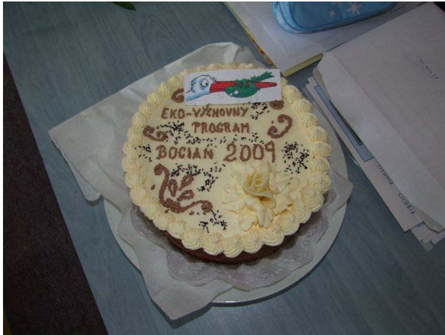
Torta pre účastníkov Ekovýchovného programu a víťazov detskej tvorby na tému Bocian v Rožňave